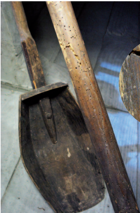
▲ Les galeries creusées par les vrillettes dans le manche de cette écope l'ont sérieusement fragilisée entraînant une cassure bien visible.

Les infestations sont difficiles à détecter parmi les trous de vrillettes et les vermoulures déjà existants. Les traces les plus évidentes sont la sciure, les cocons, les déjections ou les insectes parfaits.