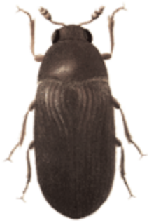
▲ Coléoptère, forme adulte de Dermeste ( Dermestes bicolor ) © F. de Mory / OCIM, muséum d'Autun.

Les collections des musées, subissent, malgré le soin apporté à leur préservation, des altérations dues à leur environnement immédiat (lumière, pollution, hygrométrie et variation de température). Les collections ethnologiques, du fait des matériaux qui les constituent (matière organique, bois, cuir, textiles, etc), font face à de nombreuses attaques biologiques, d'insectes, voire de champignons ou de moisissures. Les larves surtout engendrent des dégâts.