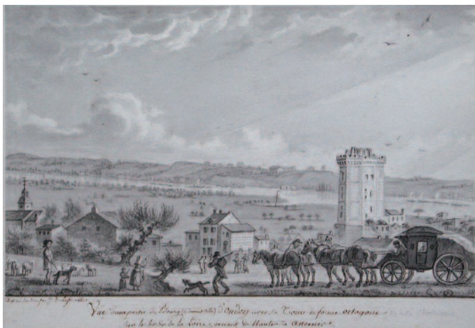
« Oudon et Champtoceaux » J. J. Delusse. Lavis. 1810. MML (inv. M2781 A 47).

Pour cette cinquième édition des « Variations équines », le Musée-Château Saint-Jean de Nogent-le-Rotrou propose de découvrir le cheval au travail à travers les représentations qu'en ont fait nombre de peintres, sculpteurs et aquafortistes, de la fin du XVIII e au milieu du XX e siècle. Le musée de la marine de Loire a participé en prêtant 4 dessins de