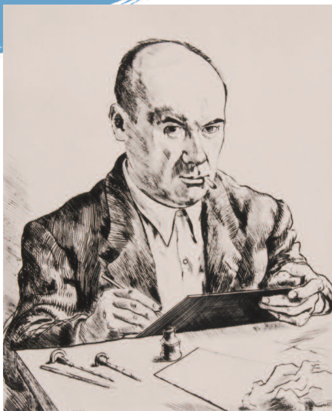
▲ Autoportrait, burin, 1952. Coll. part.